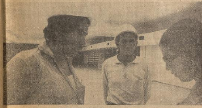
ESFUERZO Y VIGILANCIA

Por el lado de Villavicencio, la placa de la UNCTAD ofrece un aspecto casi terminado. Solo faltan detalles y se finalizan algunas obras anexas, como se puede ver en el grabado.