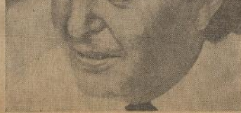
"ES CHILE TRABAJANDO"